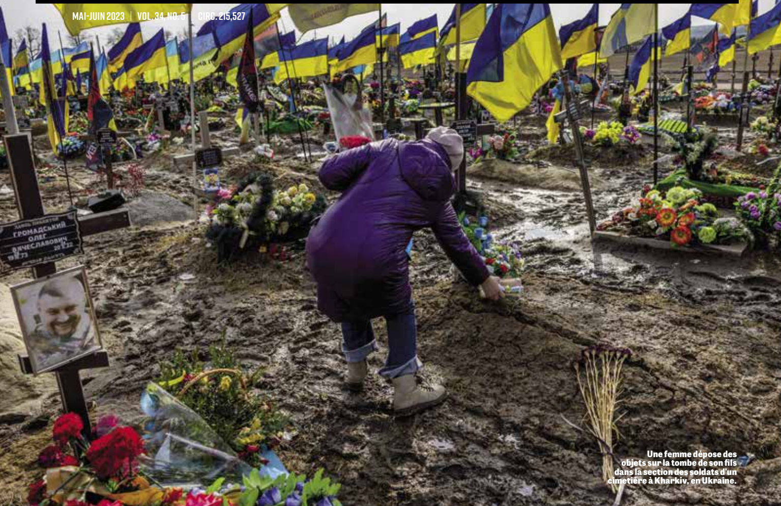
Une femme dépose des objets sur la tombe de son fils dans la section des soldats d'un cimetière à Khar'kiv, en Ukraine.