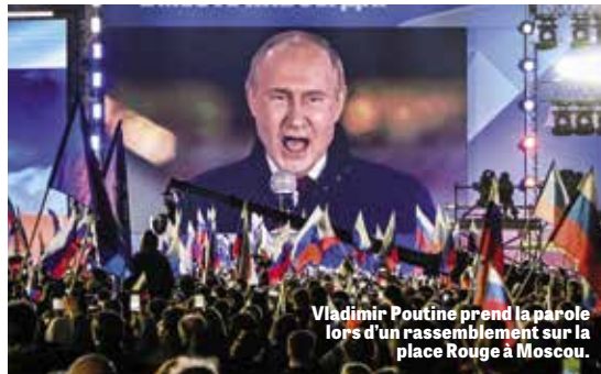
Vladimir Poutine prend la parole lors d'un rassemblement sur la place Rouge à Moscou.

Ézéchiel 38 : 8 dit : « Après bien des jours, tu seras à leur tête ; dans la suite des années... ». Remarquez qu'Ézéchiel n'écrivait