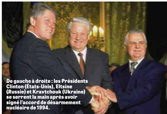
De gauche à droite : les Présidents Clinton (États-Unis), Eltsine (Russie) et Kravtchouk (Ukraine) se serrent la main après avoir signé l'accord de désarmement nucléaire de 1994.

L'Amérique, elle aussi, se retrouvait placée sous une nouvelle direction. Et qu'a fait le Président Barack Obama ? Il a ignoré