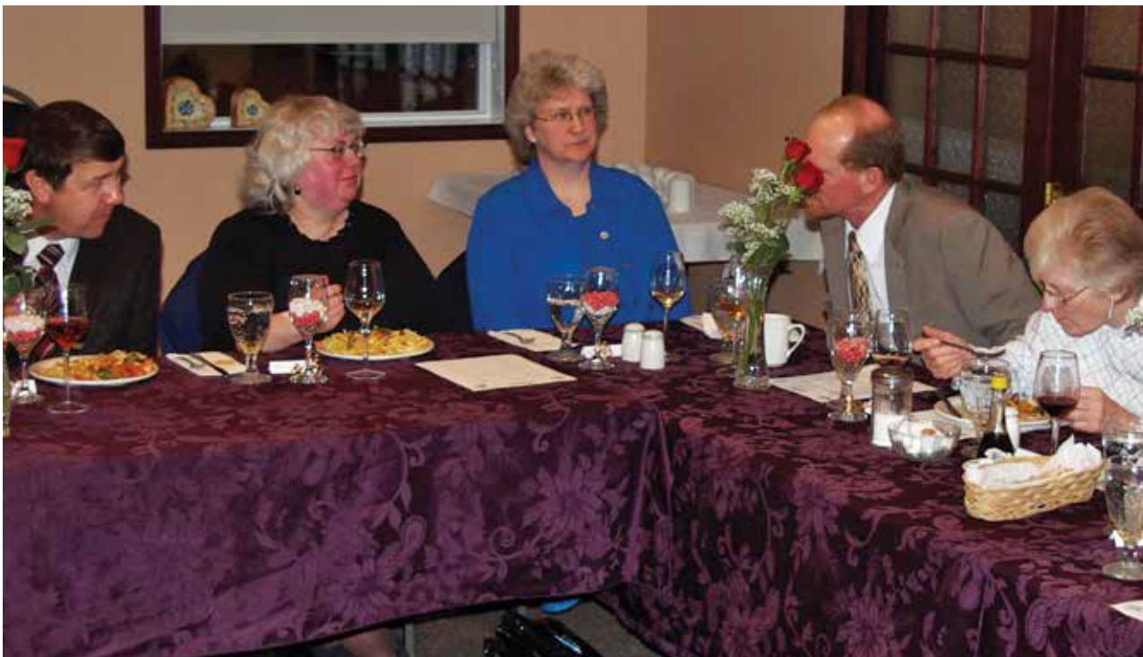
UNE SOIRÉE MÉMORABLE Chaque année, au début du premier jour de la Fête des Pains sans levain, le peuple de Dieu se rassemble en petits groupes familiaux pour un dîner, remerciant Dieu de les avoir appelés à sortir de l'esclavage du péché et à entrer dans Son Église.

Une « sainte convocation » est une assemblée religieuse ordonnée par Dieu Tout-puissant Lui-même. Aujourd'hui, les membres de l'Église de Dieu se